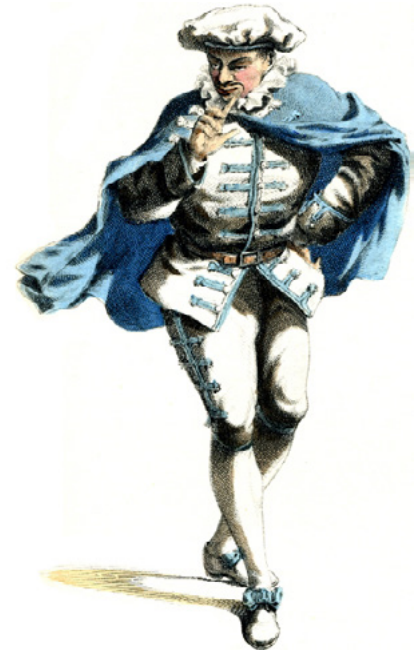
Scapino, dessin de Maurice Sand, gravure d'Alexandre Manceau, 1860 © Coll. Comédie-Française

Chaque catégorie contient à son tour les traits convenant à différentes situations, de sorte que l'on trouve des concetti relatifs à la prière amoureuse, aux épanchements lyriques, à l'amour réciproque, au mépris, à la jalousie, à la réconciliation, au dépit, aux adieux, etc. Ce théâtre se caractérise également par l'importance du corps et du jeu gestuel, mais nous ne savons rien de précis sur les jeux de scène, hormis le fait que les postures étaient si stylisées et les lazzi parfois si acrobatiques, que les témoins du temps s'avouent impuissants à les décrire. Le célèbre Scaramouche, par exemple, était un formidable acrobate qui, à quatre-vingt-trois ans, disait-on, parvenait à donner un soufflet du pied.