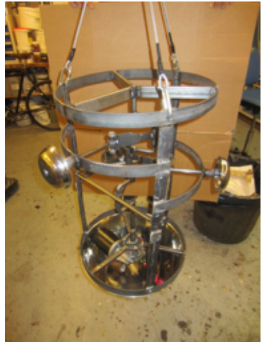
Le mécanisme caché dans le sac