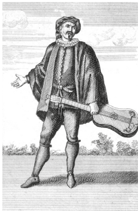
Portrait gravé de Scaramouche par Henri Bonnat, XVII e siècle

Un jeu en liberté : comme le rappelle Denis Podalydès, lorsque Molière écrit Les Fourberies de Scapin , il « partage alors l'usage du Palais-Royal avec l'acteur napolitain Tiberio Fiorilli, le grand Scaramouche en personne, vêtu de noir, homme au passé de brigand, rénovateur du jeu italien, jadis adoré du Roi qui, enfant, le découvrit et le voulut pour lui-même. Mais Fiorilli est devenu un homme bien plus libre que Molière qui, fasciné, s'en inspire pour son personnage principal. » (« Le ciel s'est déguisé ce soir en Scaramouche ») Grande figure de la commedia dell'arte , Fiorilli fait rire par sa pantomime, son jeu improvisé, ses lazzi lorsqu'il revêt l'habit de l'aventurier napolitain vantard Scaramouche. Scapin est lui aussi un type emprunté à la commedia dell'arte mais Molière complexifie le personnage en le dotant d'une imagination vengeresse et burlesque qui hérite à la fois du théâtre antique (le Phormion de Terence) et d'une tradition farcesque française (Le Pédant joué de Cyrano de Bergerac, les Farces tabariniques , courtes pièces du théâtre de foire du début du XVII e siècle que l'on doit au bateleur et comédien Antoine Girard dit Tabarin). Scapin est un valet, mais il semble libre et sans attaches (son nom vient de l'italien scappare , s'échapper), tout à la fois acteur et metteur en scène, il est l'incarnation même du théâtre et du jeu.