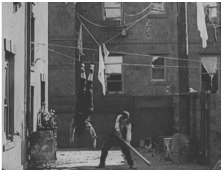
Buster Keaton, Neighbors , 1920.