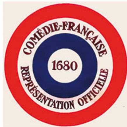
Anciens logos de la Comédie-Française