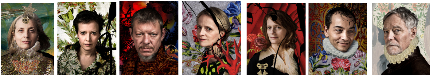
Les portraits des Comédiens-Français ont été retravaillés par Christian Lacroix pour une série intitulée Iconoclasie pour la saison 2018-2019