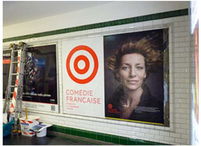
Campagne d'affichage dans les stations du métro parisien au lancement de la saison 2015-2016