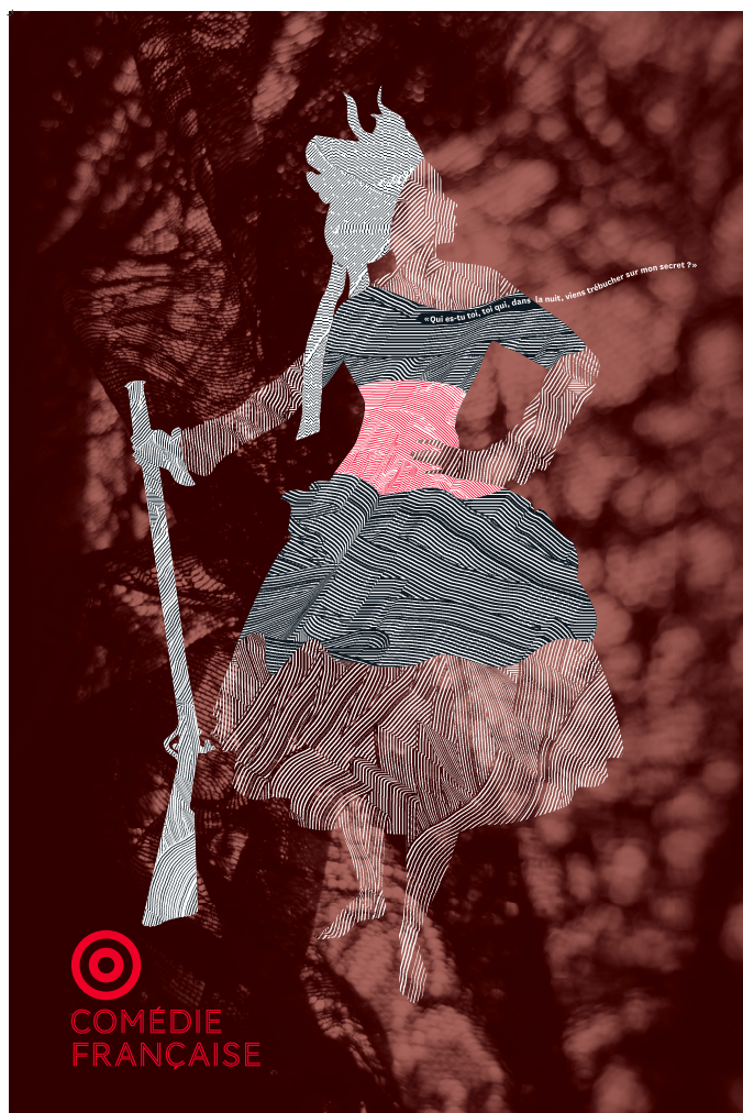
Exemple d’affiche pour la saison 2015-2016