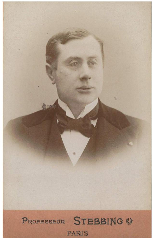
André Antoine

C'est en 1921, sous l'administration d'Émile Fabre, que le dramaturge norvégien fait une entrée remarquée au répertoire de la Comédie-Française avec Un ennemi du peuple . Pour la première fois en effet on y accueille un chef-d'œuvre étranger, exception faite des pièces de Shakespeare jouées depuis le XVIII e siècle dans des adaptations très libres, et de deux pièces écrites par Carlo Goldoni spécialement pour les Comédiens-Français.