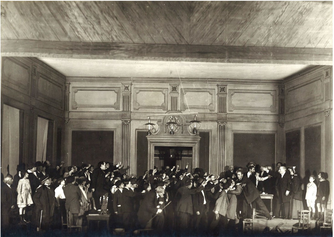
Un ennemi du peuple d'Henrik Ibsen, Paris, Salle Richelieu, 1921

La première d' Un ennemi du peuple , Salle Richelieu, se fait avec éclat et sans scandale, loin des protestations qu'avaient provoquées les premières représentations au Théâtre de l'Œuvre vingt-sept ans auparavant. Dégagée de son atmosphère brumeuse, « ibsenienne », dont se plaisaient à l'envelopper ses premiers metteurs en scènes, la pièce est présentée dans une lecture nouvelle, plus réaliste.