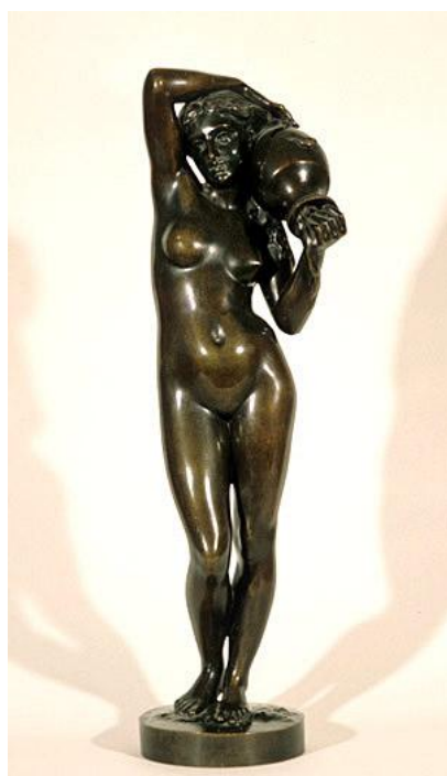
La Source par Falguière, 1880, H. 0.76 ; D. 0.20

Musée Ingres, Montauban, 03/07/2009-04/10/2009