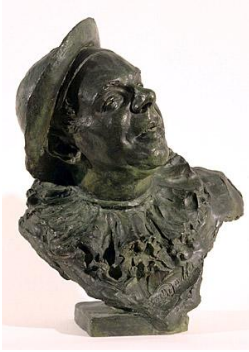
Coquelin aîné par Antoine Bourdelle, 1893, H. 0,50 ; L. 0,42 ; P. 0,30